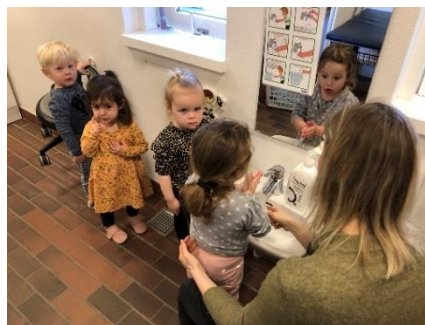
Dagligdags rutine som læringsrum

lægge rør ned. Der blev fundet arbejdshjelme, arrangeret udflugt ud og se de store maskiner og rigtige rør blive lagt, der blev hamret, banket og malet skilte og der blev tegnet maskiner og arbejdsmænd.